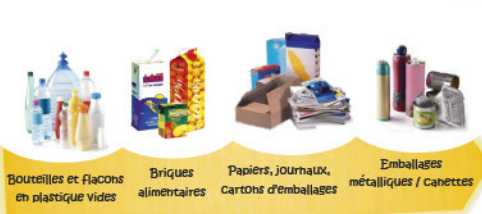
Bouteilles et flacons en plastique vides Briques alimentaires Papiers, journaux, cartons d'emballages Emballages métalliques / caquettes

Pensez à enlever les bouchons et couvercles !