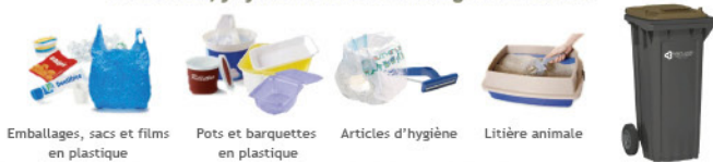
Emballages, sacs et films en plastique Pots et barquettes en plastique Articles d'hygiène Litière animale

Dans le bac, je jette les déchets ménagers résiduels :